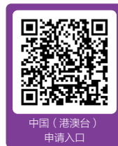
中国（港澳台） 申请入口