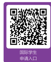
国际学生 申请入口