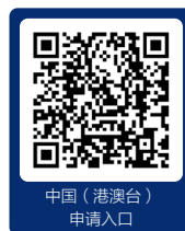
中国（港澳台） 申请入口